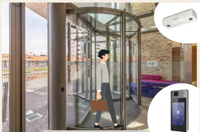
Entrée & Sortie

La solution est conçue pour que la mairie puisse contrôler rapidement la température, le port de masque, et la densité de visiteurs à l'entrée et la sortie et le hall de bureau pour fournir un environnement plus sûr et sain.