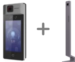
DS-K1T671TM-3XF + DS-KAB671-B (En option)