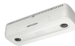
Caméra réseau de comptage de personnes à double objectif