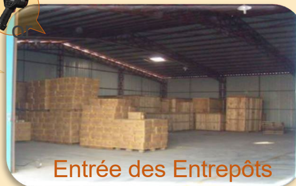
Entrée des Entrepôts