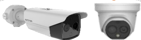
Caméras Thermiques HD de Détection de température corporelle