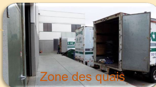
Zone des quais

Détection basée sur la température de la peau avec une grande précision ( \pm 0,5^{\circ}\text{C} ) sans interférence environnante