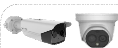
Caméras Thermiques HD de détection de température