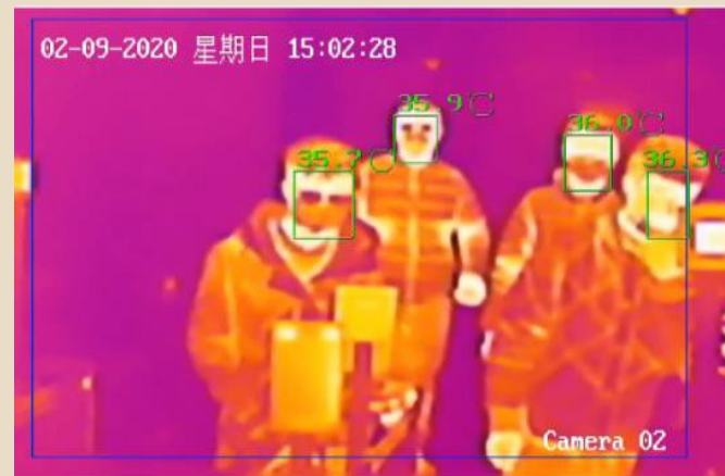
Détection basée sur la température de la peau avec une grande précision ( \pm 0,5^{\circ}\text{C} ) sans interférence environnante; dépistage simultané de la fièvre jusqu'à 30 personnes.