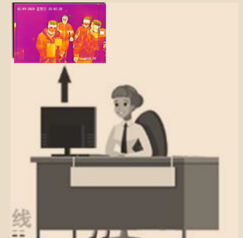
Détection rapide de la température corporelle avec alarme de température élevée (image contextuelle / avertissement audio)