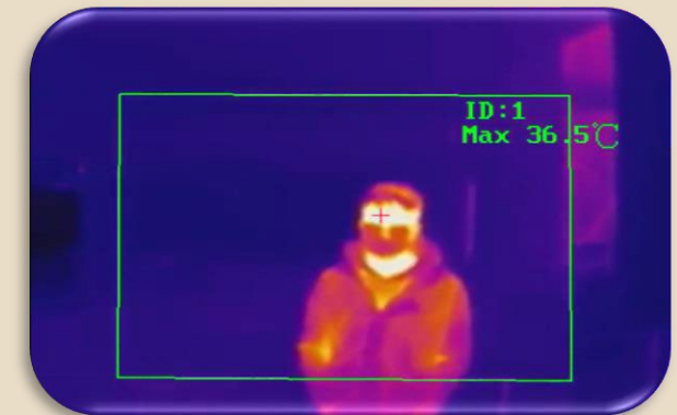
Détection rapide de la température corporelle avec alarme de température anormale (image contextuelle / avertissement audio)