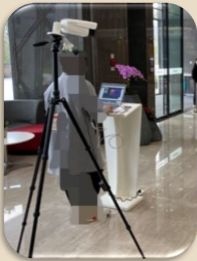
Installation et utilisation facile sur trépied

La solution utilise une caméra thermique pour détecter efficacement la personne ayant une température corporelle anormale et aider la réception à guider en temps opportun les patients suspectés de fièvre vers une zone spécifique pour un contrôle plus approfondi et un traitement médical.