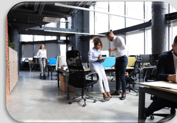
Bureaux / Open spaces