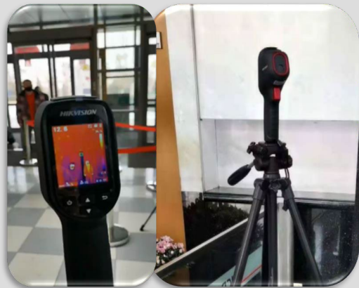
Entrée des petites entreprises

Les caméras thermique de détection de température corporelle de Hikvision sont conçues pour détecter des températures cutanées élevées pour un dépistage rapide et préliminaire de la fièvre dans les bureaux et les sièges sociaux, puis pour fournir des conseils supplémentaires aux patients suspectés de fièvre.