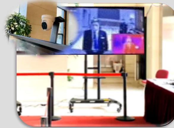
Hall d'entrée des sièges sociaux