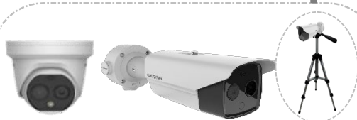
Caméra Thermique Bullet HD de détection de température