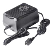
TEAC-66-243000V (UE) MKAC-66-243000U (ÉTATS-UNIS) TEAC-66-243000VB (ROYAUME-UNI) Bloc d'alimentation