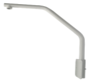
DS-1660ZJ Montage en parapet