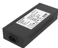
Injecteur Hi-PoE No.555 Qianmo Road, Binjiang District, Hangzhou 310051, China T +86-571-8807-5998 overseasbusiness@hikvision.com