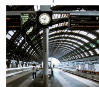
Station de train