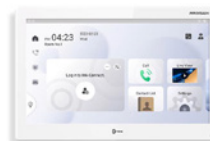
DS-KH9510-WTE1 Monitor Pro Series Pantalla de 10.1"