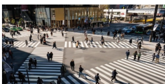
Passages pour piétons