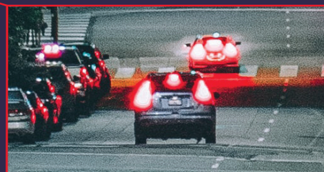
Vue PTZ détaillée