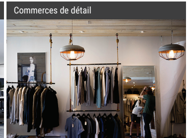
Commerces de détail