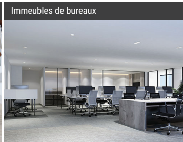
Immeubles de bureaux