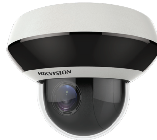
Mini-caméra réseau PTZ extérieure IR DS-2DE2A4041W-DE3