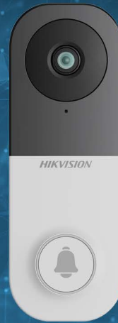
Sonnette intelligente Wi-Fi