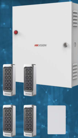
Ensembles de contrôle d'accès