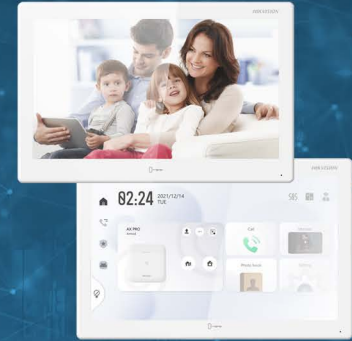
Station intérieure d'interphone vidéo