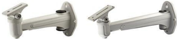
DS-1212ZJ 壁装支架适用于室内 DS-1213ZJ 壁装支架适用于室外