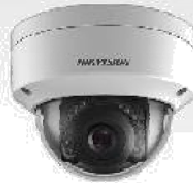
Lente fixa 2.8mm