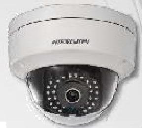
Lente fixa 4/6mm