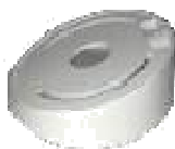
Inclined ceiling mount