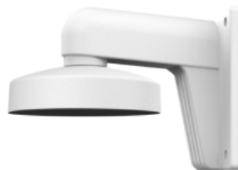
Suporte para montagem na parede em ambientes internos