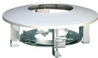
Suporte para montagem no teto para ambientes internos